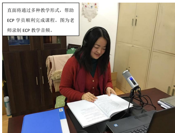
直面将通过多种教学形式，帮助 ECP 学员顺利完成课程。图为老师录制 ECP 教学音频。

(5) 学员较多的地区会设立教学点大家可以集中学习讨论，直面也会并定期派老师到当地面授课程，指导大家学习。