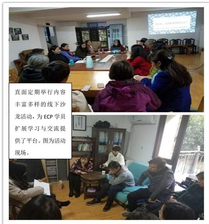
直面定期举行内容丰富多样的线下沙龙活动，为 ECP 学员扩展学习与交流提供了平台。图为活动现场。

答：ECP 是一门函授课程，我们会把 12 本教材寄给全国各地的学员，大家通过阅读、思考教材和实践，最终完成作业和考试。除了阅读教材，还会陆续有一些音频教学内容，