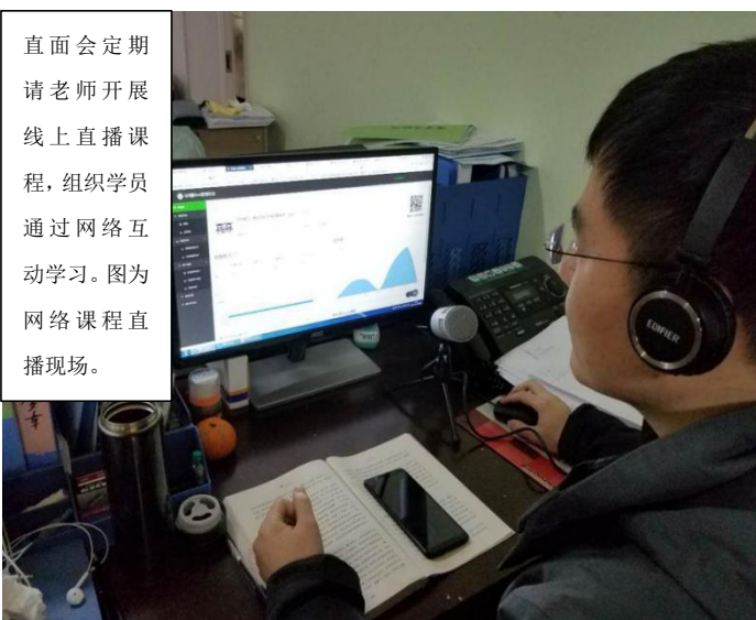
直面会定期 请老师开展 线上直播课 程，组织学员 通过网络互 动学习。图为 网络课程直 播现场。

(6) 直面每年会有两期由王学富博士主讲的面授课程，其中不仅涉及 ECP 书本内容的学习，还有大量案例实操。每期三天，在直面举办。ECP 学员收取很低的费用就可以参加，并获得与王学富博士面对面交流的机会。