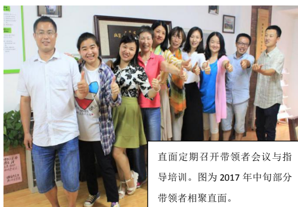
直面定期召开带领者会议与指导培训。图为 2017 年中旬部分带领者相聚直面。

“学点心理学，了解自己，改善自己与他人的关系，并有勇气正面拒绝那些对身心有害的事物。”